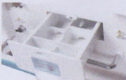
The humidity reservoir is removable