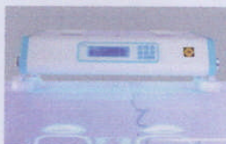
Phototherapy unit(option) BBP-1000B/2000B