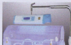
Phototherapy unit(option) BBP-3000B